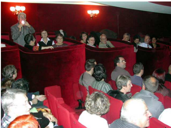
au Théâtre Saint-Georges, tout baigne !

Il était temps de gagner le restaurant Le Bouillon Chartier où nous commençons à avoir nos habitudes : ambiance chaude et cordiale d'une brasserie typique de trépidation parisienne.