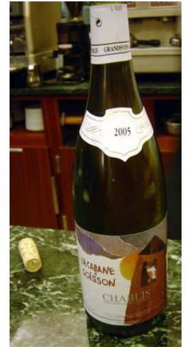
Chablis du député