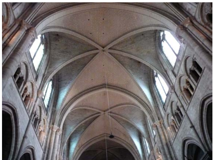
détail de la nef de la cathédrale Saint-Etienne

À 17 heures, le groupe s'est rendu au parc du Moulin de Tan, pour une visite des serres tropicales, peuplées de dizaines de plantes des régions tropicales humides, sèches et arides, sous la direction d'un responsable passionné ; certains auraient volontiers prolongé leur promenade dans ces belles ripisilves, agréablement aménagées, mais le programme de l'après-midi comportait aussi la visite d'un lieu aimable pour les gosiers secs : la visite d'une des rares fabriques de bière de la région Bourgogne, clin d'œil de Gérard Fromentin, dont la vie professionnelle s'est largement déroulé dans ce secteur alimentaire.