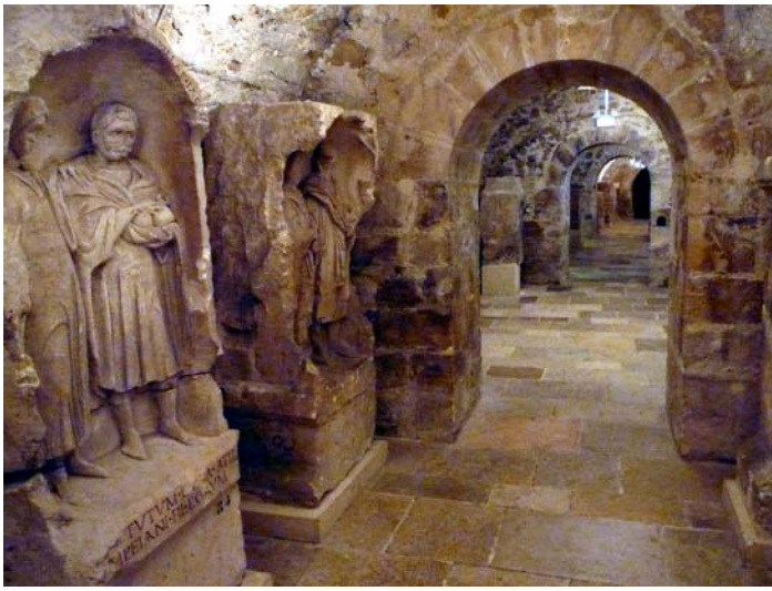
collections gallo-romaines du musée