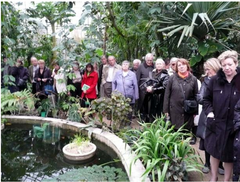
Parc du Moulin à Tan : la moitié du groupe dans les serres tropicales